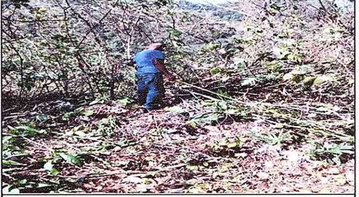
Foto 2: Mantenimiento por falta de Circulacion del predio escolar