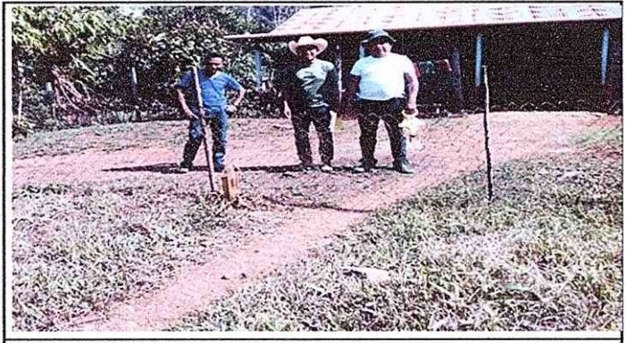
Foto 1: Manetenimiento de circulación del predio del Establecimiento